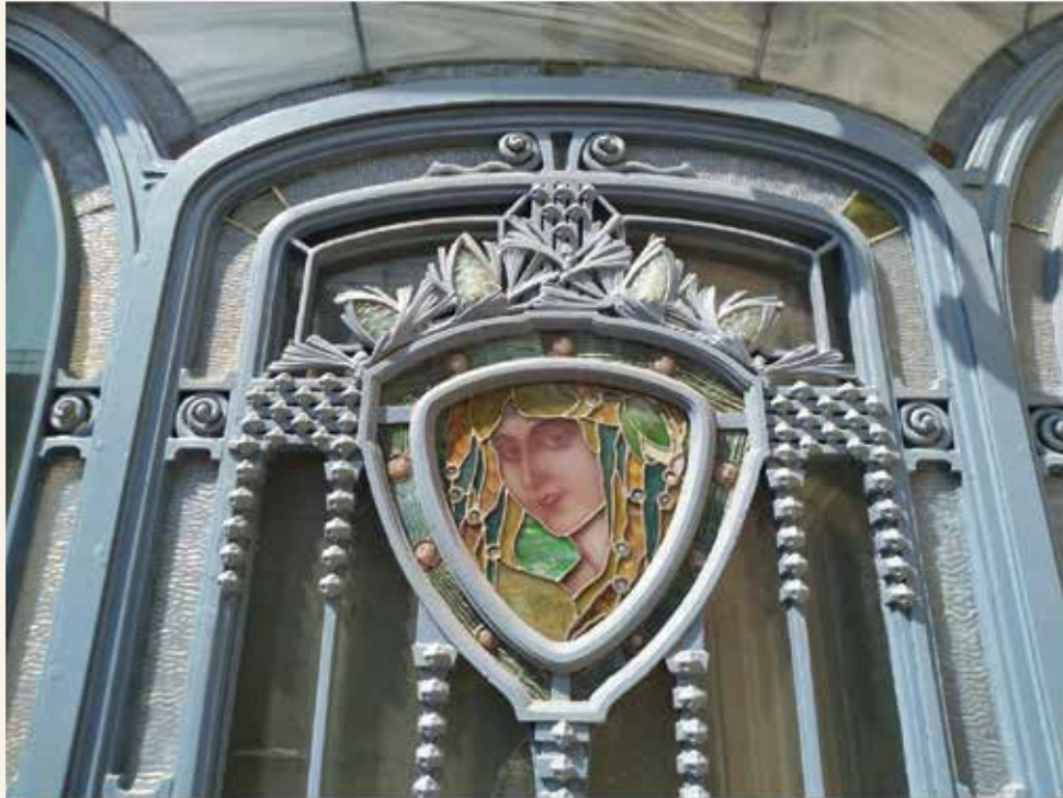
Kunst in Nancy