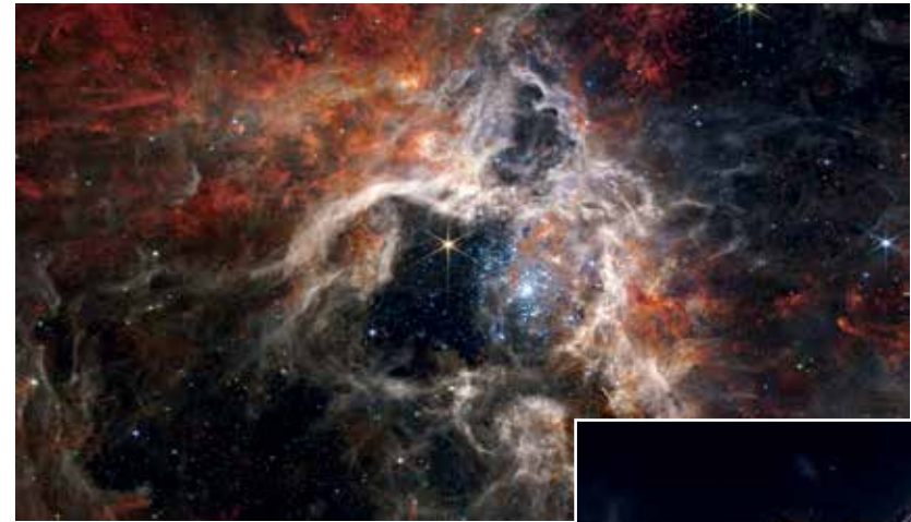
Foto's van de James Webb Telescope

Datum: 7 september 2026 Tijd: 20.00 uur Locatie: de Wormerveerse Vermaning