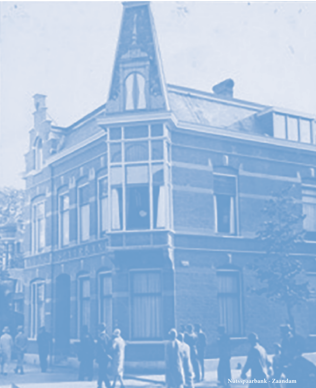
Nutspaarbank - Zaandam

Nut Zaanstad is een Algemeen nut beogende instelling (ANBI).