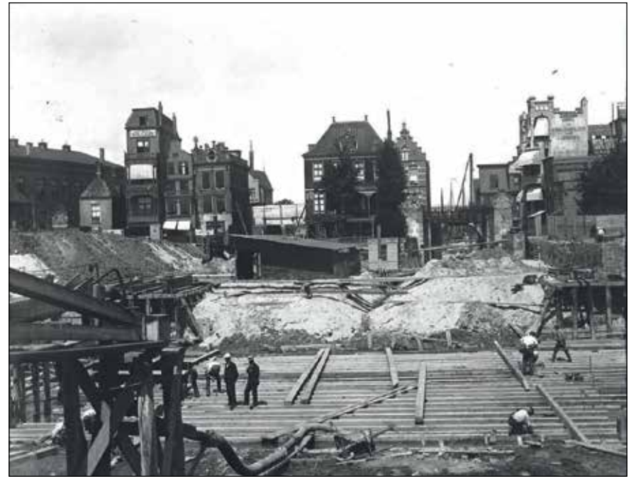
Bouw Wilhelminasluis Zaandam ca. 1902

Maar hij heeft nog alle tijd om dit te bedenken. Gezien zijn kennis en het hebben van veel beeldmateriaal wordt dit vast een mooie avond.