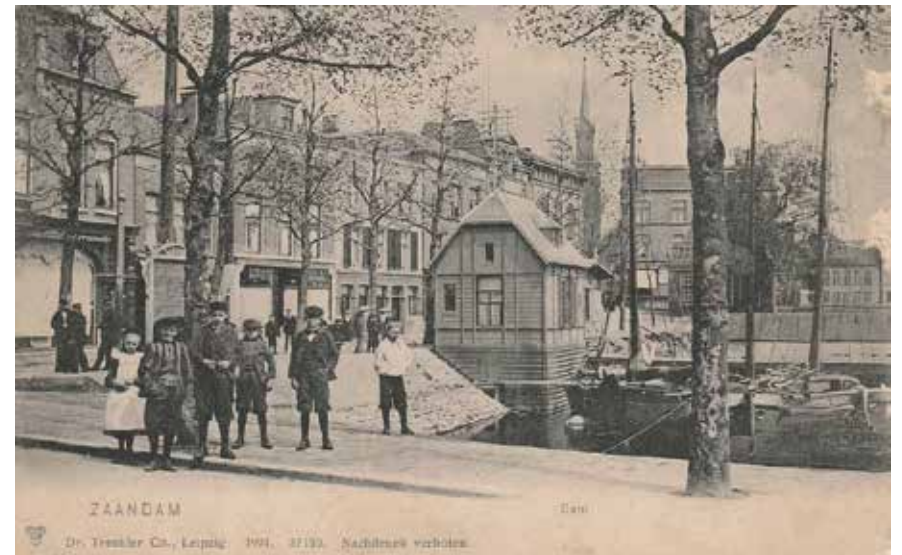
Havenkom Zaandam, eind 19 e eeuw

Datum: maandag 3 november 2025 Tijd: 20.00 uur Locatie: de Wormerveerse Vermaning