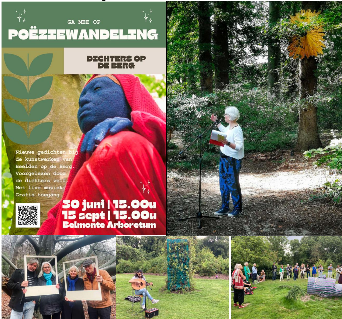
Vernoeming Nut op website organisatie: nvt Aanleveren van materiaal voor website 't Nut: wel

Het Wageningse Nut heeft subsidie verstrekt aan het initiatief om beelden van de Expositie “Beelden op de Berg” van nieuwe gedichten en live muzikale ondersteuning te voorzien. In totaal waren er 16 dichters betrokken en 4 buddy dichters die woonachtig zijn in AZC Wageningen. In totaal waren er 21 gedichten, 85 enthousiaste deelnemers aan de gratis poëziwandelingen en hebben maar liefst 1000 mensen aan de audiotour meegedaan.