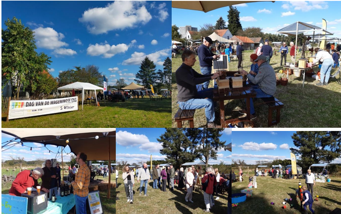
Vernieuwing Nut op website organisatie: wel Aanleveren van materiaal voor website 't Nut: wel