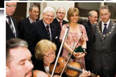
Impressie van de viering van het 225-jarig jubileum van de Maatschappij tot Nut van 't Algemeen in het Nationaal Onderwijsmuseum.