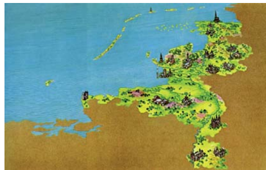
Nederland zonder dijken en gemalen. Tekening Henri Verhagen, uit Waterschappen in Nederland

zijn; daarom wellicht ook van hun kant in het vervolg een toenemende congresdeelname. Met dit congres en met de naar aanleiding daarvan uitgebrachte inspiratiemap wil het Maatschappijbestuur de departementen stimuleren om samen met de waterschappen presentaties en/of excursies over dit thema te organiseren. Tijdens de jaarvergadering is besloten mij - na het aflopen van mijn zittingstermijn - opnieuw tot voorzitter te benoemen. Samen met mijn medebestuurders en met de medewerkers van ons bureau hoop ik ook in de komende periode positief bij te dragen aan de bloei van onze Maatschappij tot Nut van 't Algemeen; voor mij ligt daarbij een accent op wederzijds respect en ruimte voor eigen initiatieven van onze departementen.