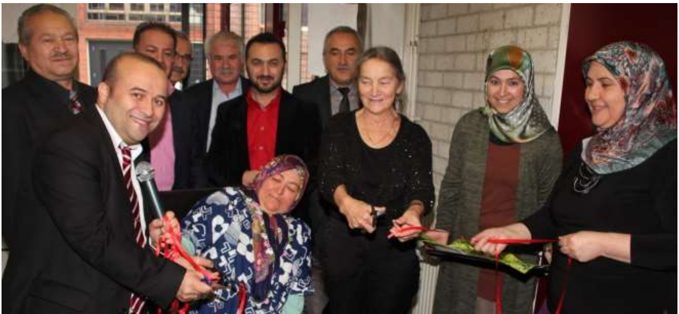
Foto: officiële opening invalidentoilet

De stichting Rijnmond Multicultureel Centrum zet zich in voor de multiculturele samenleving in Rotterdam. Hiertoe organiseert de stichting met vrijwilligers tal van activiteiten voor de voornamelijk allochtone achterban in de regio Rijnmond. De activiteitenlocatie is 7 dagen per week geopend en dient als ontmoetingsruimte. Er worden bijeenkomsten georganiseerd, buurtfeesten, voorlichtingsavonden en culturele uitstapjes.