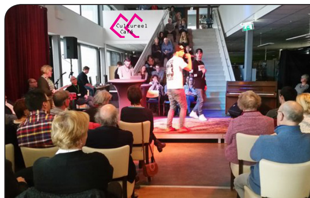
Cultureel Café met 'Loodzwaar'

Het Cultureel Café is een zeer afwisselend programma op de zondagmiddag, met korte optredens van verschillende ensembles en artiesten. Muziek, dans, toneel en cabaret vormen de hoofdmoot. De optredens worden afgewisseld met interviews en informatie over andere culturele activiteiten. Het podium biedt plaats aan zowel amateurkunstenaars als professionele kunstenaars, waarbij extra aandacht wordt besteed aan regionaal talent. De optredens vinden te midden van het publiek plaats in een informele sfeer en met pauzes voor een drankje.