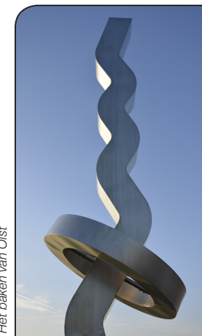
Het baken van Olst

'Het Nut' ofwel 'Maatschappij tot Nut van 't Algemeen' werd opgericht in 1784. Doelstellingen waren toen onder andere het streven naar algemeen volksonderwijs en opvoeding in een geest van verdraagzaamheid en respect. Het NUT nam initiatieven daar waar de staat toentertijd tekort schoot. Op een aantal plaatsen in Nederland zijn de Nutsdepartementen blijven voortleven als algemene verenigingen die sociale en culturele activiteiten organiseren.