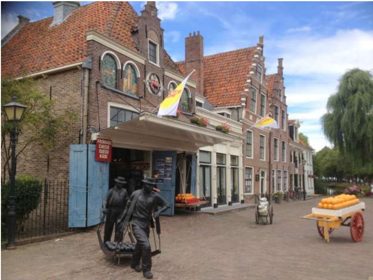
Foto: Jan Nieuwenhuizenplein, Nutspand direct gelegen naast rechtervlag

De kosten voor onderhoud van dit rijksmonument uit 1622 overstijgen al jaren de inkomsten uit de gebruiksvergoedingen. Er waren tot medio juni 2017 nog twee gebruikers gevestigd, die zich bezighouden met onderwijs en cultuur.