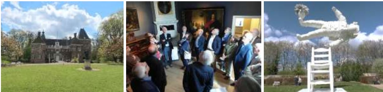
Foto's: rondleiding rond en in Kasteel Het Nijenhuis

in Overijssel. Het ligt tussen de dorpen Heino en Wijhe in een prachtig groen landschap. De Nutsleden worden rondgeleid door de tuin en het museum. In elke ruimte is moderne kunst op een fraai wijze ingepast binnen het authentieke interieur. Iedereen was het erover eens. Dit kasteel met museum is te mooi en er is te veel te zien voor een bezoek van slechts anderhalf uur. In het Holstohuis in Olst wordt na afloop nog genoten van een 'NUTTige' nazit.