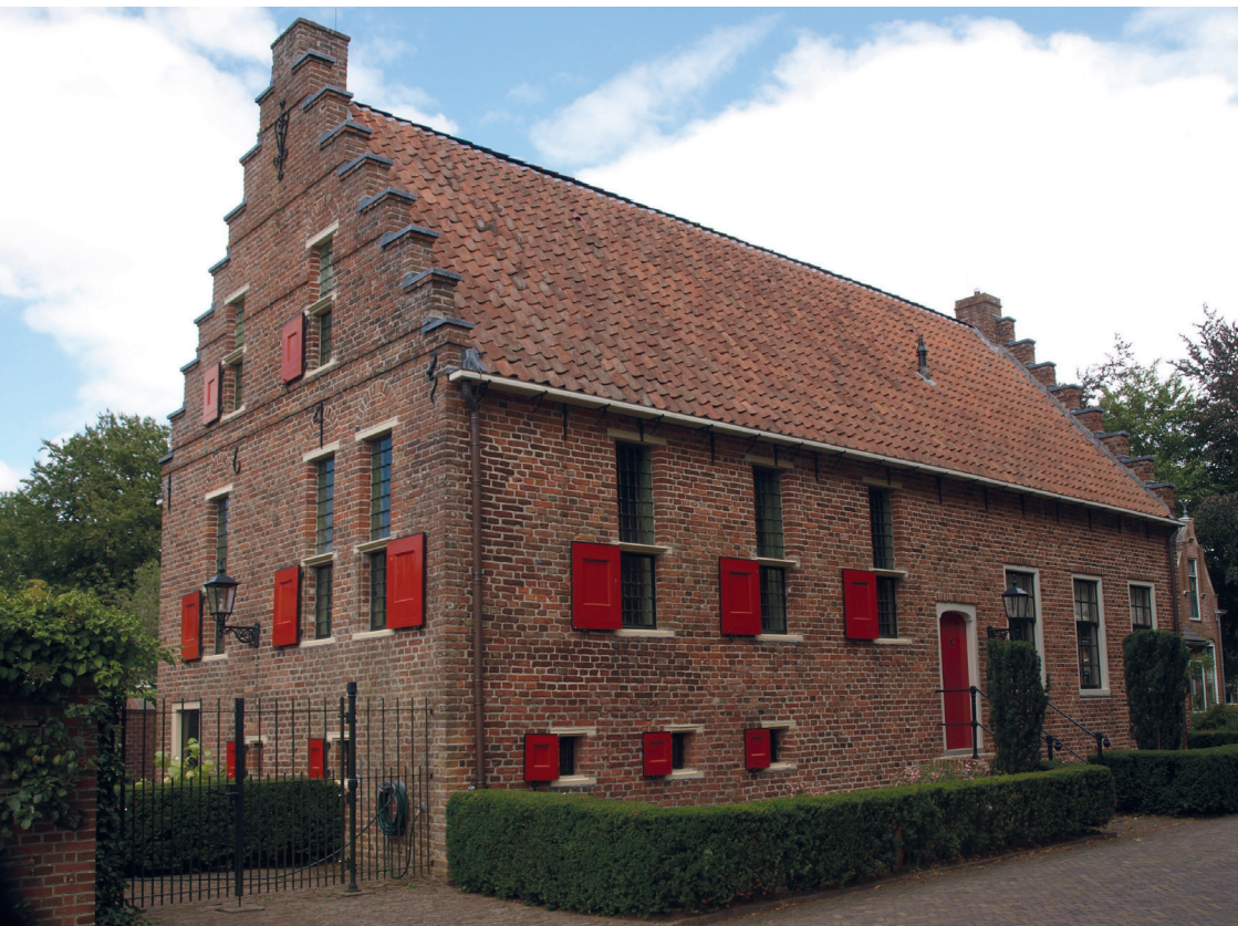
Het Rechthuis, Bellingwolde

Maatschappij tot Nut van 't Algemeen afd. Bellingwolde