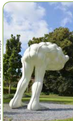
Gaik of Gaik van de Spacecowboys

'Het Nut' ofwel 'Maatschappij tot Nut van 't Algemeen' werd opgericht in 1784. Doelstellingen waren toen onder andere het streven naar algemeen volksonderwijs en opvoeding in een geest van verdraagzaamheid en respect. Het NUT nam initiatieven daar waar de staat toentertijd tekort schoot. Op een aantal plaatsen in Nederland zijn de Nutsdepartementen blijven voortleven als algemene verenigingen die sociale en culturele activiteiten organiseren.